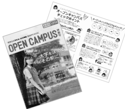
近年、東日本の高校中心に活用されている『逆引き大学辞典進路研究』 当方特集記事は進路指導に好評

※上記費用で学生・生徒募集研修も可能です 内容は広報の基本実務がベースとなります